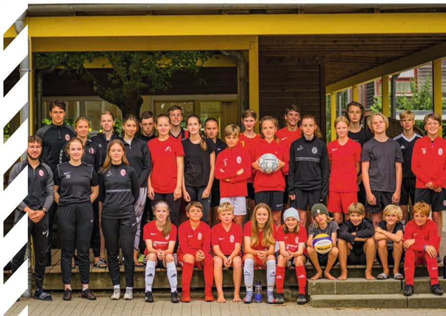
Die „Camp on tour“ - Crew im Sommer 2022

Wann: 17.07.- 23.07.2023 Für: Kinder von 8-14 Jahren Wo: Ferienanlage Schönhagen Gebühr: 415 / 435 Euro (ETV-Kinder / Gastkinder) inkl. Übernachtung und Verpflegung